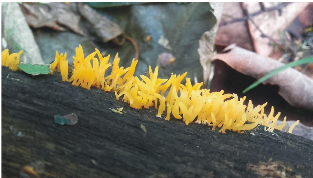
Pięknoróg szydłowaty Calocera cornea w okolicach Łodzi.

Na majowe spotkanie, które odbędzie się 19.V.2017 r. , zapraszamy w teren. Proponujemy wycieczkę do Parku Krajobrazowego Puszcza Zielonka. Spotykamy się o godzinie 9.30 przy leśniczówce Annowo (dojazd i powrót we własnym zakresie). Przewidujemy 3-4 godziny w terenie. W załączniku znajduje się mapa z lokalizacją leśniczówki.